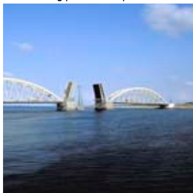
Aggersundbroen er vigtig for både erhvervs- og persontransport.