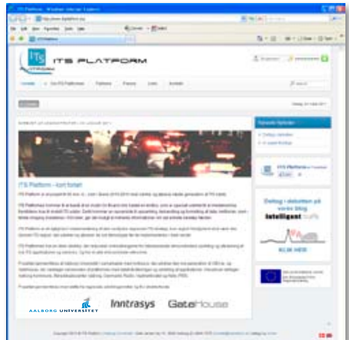
www.itsplatform.eu er en åben platform for applikationer, som hjælper bilisterne.