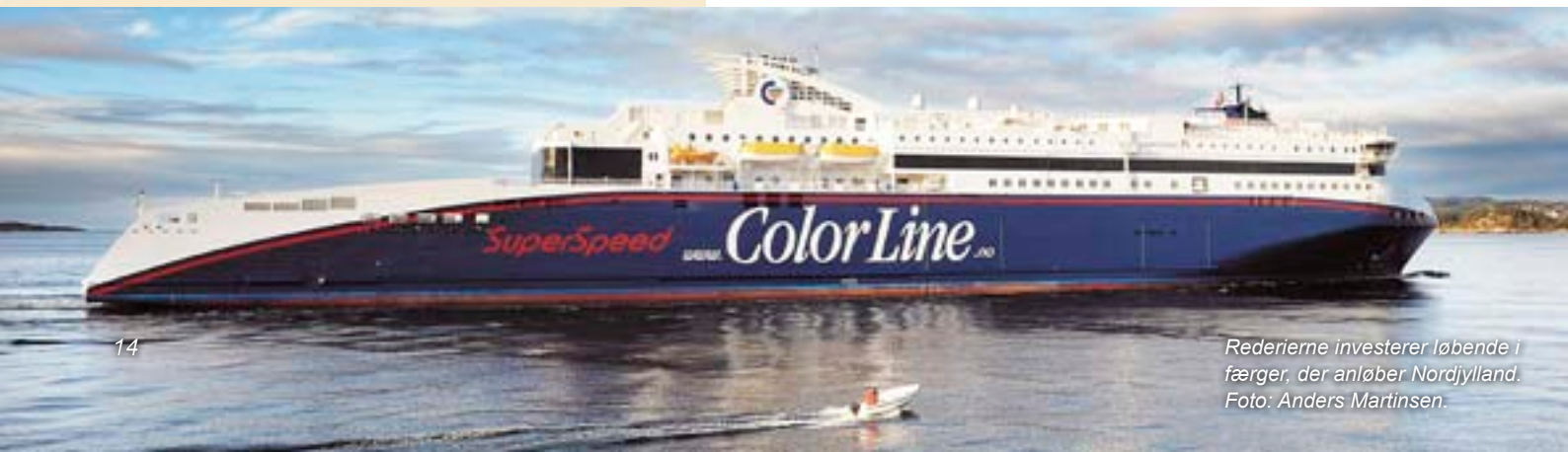
Rederierne investerer løbende i færger, der anløber Nordjylland.

De nordjyske havne og infrastrukturen frem til havnene bør ses som en central del af adgangen til Sverige, Norge og Nordatlanten. Staten bør arbejde for at sikre denne infrastruktur status i arbejdet med det trans-europæiske transportnetværk (TEN-T).