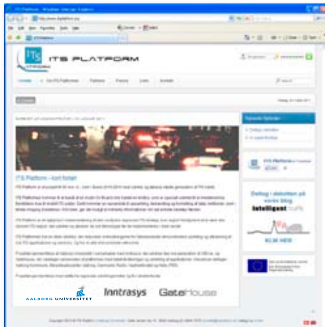
www.itsplatform.eu er en åben platform for applikationer, som hjælper bilisterne.